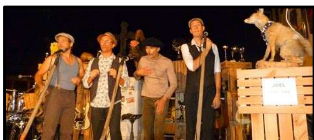
Concert des Chrétiens des Alpes - juin 2018

Vous êtes donc tous les bienvenus pour intégrer cette association avec une invitation toute particulière aux parents d'anciens élèves : ne perdez pas la main et rejoignez-nous (comitedesfetesdemures@gmail.com) !