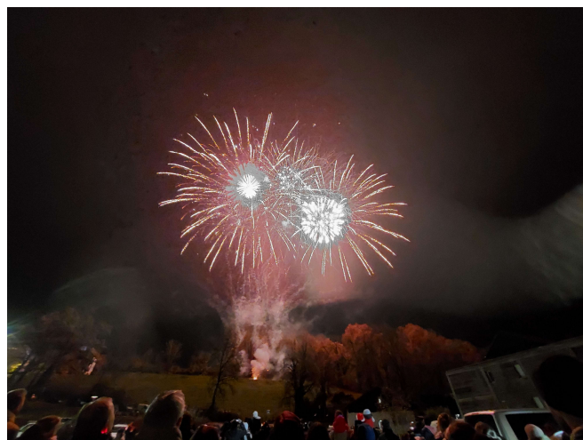
Magnifique feu d'artifices des associations au marché de Noël