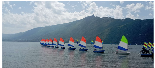
Stage de voile sur le lac d'Aix les Bains au printemps 2022

Tout ça nous donne vraiment envie de faire des choses pour les enfants, c'est la motivation première. Ils ont la chance d'être dans une école de village et ils sont dans des conditions optimales.