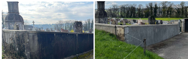
Le mur du cimetière avant et après les travaux